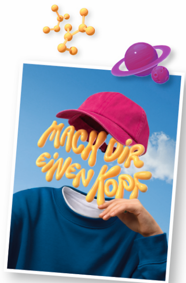
59. Bundeswettbewerb Jugend forscht 30. Mai bis 02. Juni 2024 in Heilbronn

1998 – Im Oktober findet das erste PerspektivForum für Alumni in Stuttgart statt. Fachleute diskutieren dort mit Studierenden und Promovierenden, die in den Jahren zuvor erfolgreich am Bundeswettbewerb teilgenommen haben, über aktuelle Zukunftsfragen.